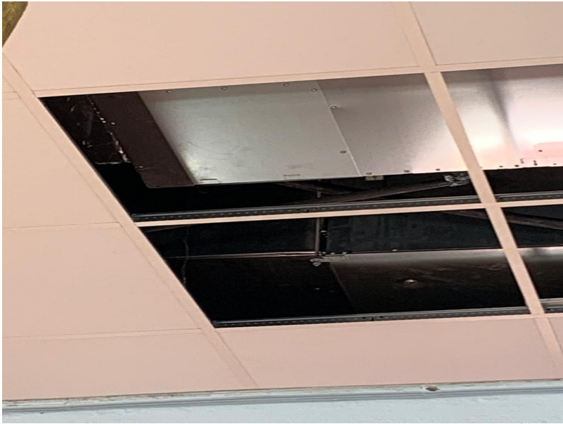
( http://www.villablanca.es/export/sites/villablanca/es/.galleries/Municipio-00001/IMG-20220117-WA0003.jpg )