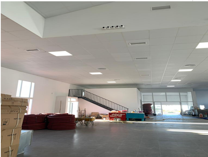
( http://www.villablanca.es/export/sites/villablanca/es/.galleries/Municipio-00001/IMG-20220117-WA0004.jpg )